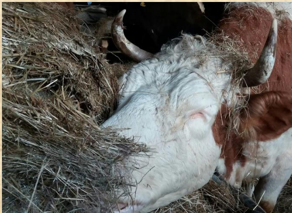
Vroni mit Leib und Seele im Stall

Ebenfalls auf Trab halten uns unsere Katzen aus der Kastrationsaktion. Nicht alle wollten nach der Kastration wieder hinaus ins Freie. Einige blieben trotz geöffneter Fluchtwege vorerst lieber im Haus. Die Kranken konnten gesund gepflegt werden. Mehrere sind so zahm und wunderbar, dass ich sie an gute Plätze vermitteln möchte. Aber bisher ist das leider mangels Anfragen nicht gelungen. Sehr bedanken möchte ich mich für die Geld- und Sachspenden, die der Versorgung der zurzeit 20 Katzen im Haus dienen. Katzenstreu und Futter wird auch weiterhin benötigt.