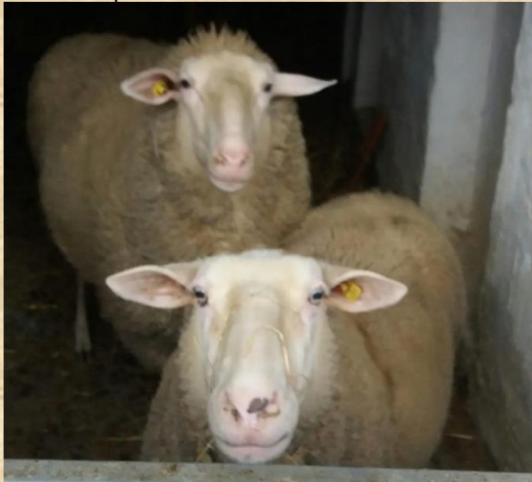
Heinerbert vorne und Frieda

Ebenso würden wir uns über Zuschüsse zu Weihnachtsleckerlis für Rinder, Schafe, Schweine, Einhufer und Ziegen freuen. Die Kosten dafür belaufen sich pro Sack Möhren und Rote Bete auf 5 €, pro Sack Heucobs auf 12 € und pro Malzleckschale auf 30 €.