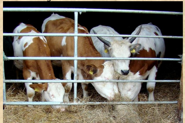
Diesel, Bruno, Daisho, Bella

Vertreter ihrer Art. Außerdem gibt es einige Rinder, die ohne bestimmte andere nicht klarkommen und auch solche, denen fast alle anderen auf die Nerven gehen. Kommt euch das bekannt vor? Genauso ist es: Die Unterschiede zwischen Menschen und Rindern werden gemeinhin als zu groß eingeschätzt. Es gibt außerordentlich viele Gemeinsamkeiten. Leider helfen die Gruppenzusammenstellungen vom letzten Jahr nur bedingt weiter. Wir hatten inzwischen Neuzugänge, ein paar Tiere sind inzwischen zu alt und gebrechlich für eine große, wilde Gruppe, die Kälber sind deutlich gewachsen und haben sowohl einen anderen Platzbedarf entwickelt, als auch das Temperament etwas verändert. In der Regel eher zum Flegelhaften hin, da es nun halbwüchsige Puberkühe sind.